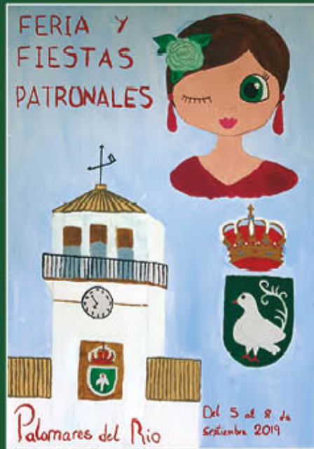
1º PREMIO CARTEL INFANTIL FERIA Y FIESTAS PATRONALES 2019