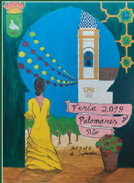
2º PREMIO CARTEL ADULTOS FERIA Y FIESTAS PATRONALES 2019